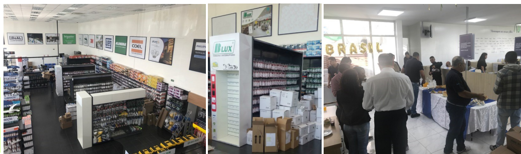
À esquerda: vista da parte interna nova loja (Marginal Tietê). Centro: Display B-Lux e Banner. À direita: Café da manhã com colaboradores

duração aproximada de 15 minutos, abordando todos os produtos Building & B-Lux. Logo após o treinamento foram recepcionados por nossa equipe com um café da manhã. A loja recebeu 2 expositores que estão nas laterais das gôndolas, as quais serão abastecidas com produtos B-Lux, facilitando a visualização e aquisição dos produtos pelo consumidor. Desejamos muito sucesso para toda a equipe nesta nova fase!