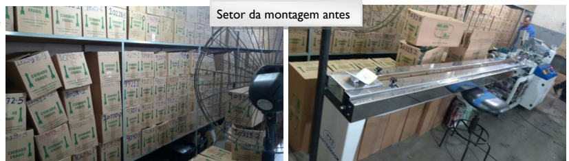
Setor da montagem antes

Estas mudanças visam um ambiente mais limpo e sensação de ampliação da área, além de facilitar a separação de pedidos e a montagem.