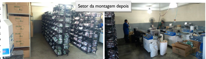
Setor da montagem depois