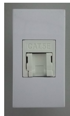
Módulo com novo RJ 45 com tampa