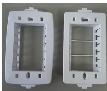
Suporte 4x2 3 Postos (Linha Home): Modelo novo (à esquerda) e antigo (à direita)

Também foi feita uma pequena redução do tamanho da furação onde são encaixados os parafusos, proporcionando maior fixação.