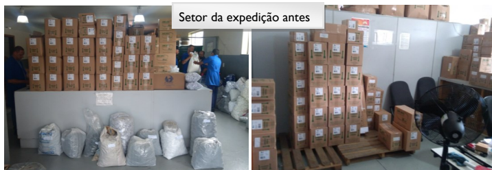
Setor da expedição antes

Parabéns a todos que participaram e podemos notar que todos ganham com isso!