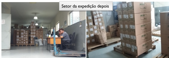
Setor da expedição depois