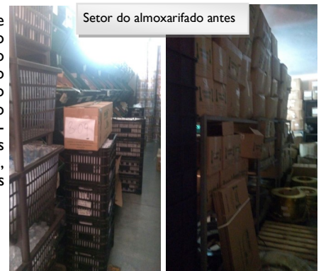
Setor do almoxarifado antes

A próxima etapa, que será feita no começo do ano que vem, é o novo endereçamento dos componentes junto com a alimentação do sistema, os quais ajudarão na identificação dos materiais. Além disso, serão feitas algumas demarcações no chão.