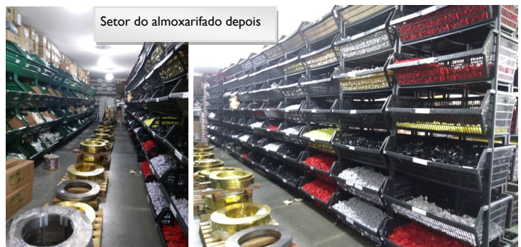
Setor do almoxarifado depois