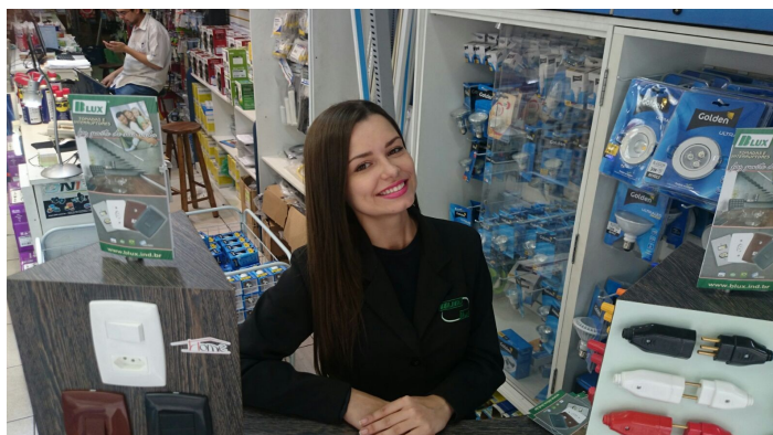
Loja Elbran- Sta. Ifigênia - 15/07/15

Todas estas empresas foram bastante receptivas e nos ajudaram com informações preciosas para melhorarmos nosso atendimento e produtos, sugerindo novos produtos e participando com novas ideias.