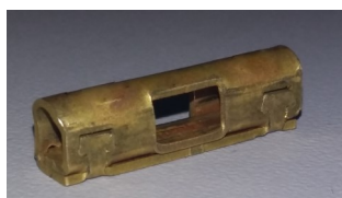
Protótipo Conector BPE Estampado

Movimente-se de maneira espontânea e animada!