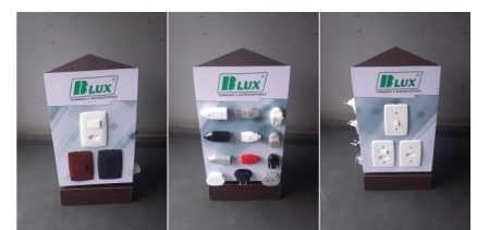
Totem de Balcão B-LUX 2016