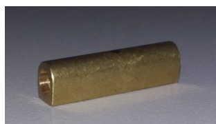
Conector BPE Usinado sem passar pela máquina de furo vertical e de rosqueamento