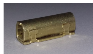
Conector BM Estampado