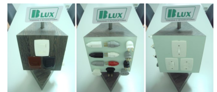
Totem de Balcão B-LUX antigo

almente sofreram reajustes, com mudança de layout, adotando um tom claro na cor de fundo para dar destaque aos produtos que possuem cores mais escuras como é o caso das cores grafite e marrom, da linha Home. Também tiveram um aumento de 10 cm para que o logo B-LUX seja inserido no topo e seja visualizado em todas as faces da peça, fixando mais a marca na mente do consumidor. Com esses ajustes o tubo de suporte ficou praticamente embutido e acreditamos que desta forma minimizará o impacto de um antigo problema que era a corrosão do mesmo em clientes que ficam localizados próximo a maresia.